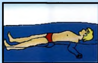
Лежа на спине