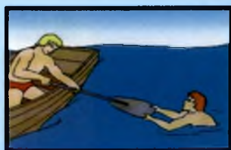
Весло или шест