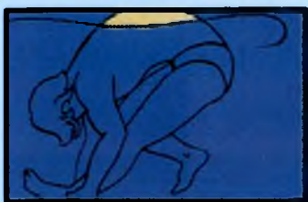
Погрузиться с головой в воду и распрямить ногу